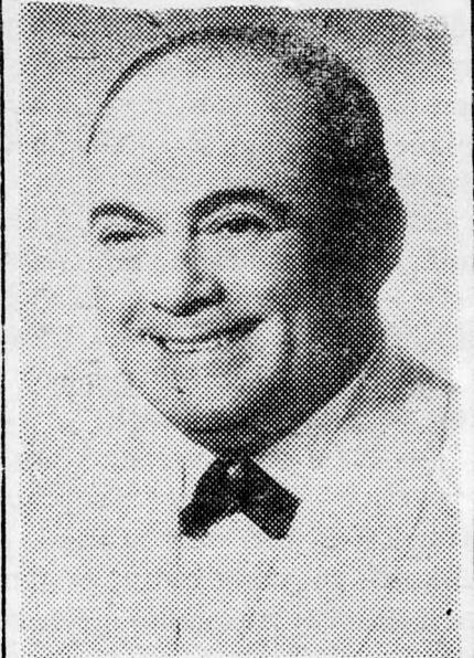
Virtuóz VARNAL-WITTENBERG Dachau nem volt rá kíváncsi