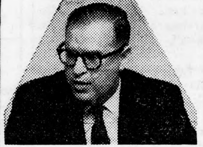
ABEVEN Nem kezdeményeztük

A műsorban megszólaltatotték Aba Even külügyminiszter és Nasszer is. A külügyminiszter azt hangoztatta, hogy Izrael soha nem követelte újabb fegyverek behozatalát a Közel-Keletre és nem is fogja sohasem tenni ezt.