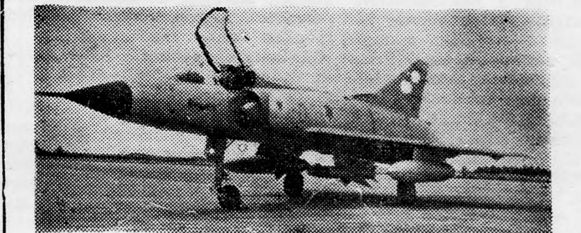
A „Matra” egy felszállásra készülő „Mirage” hasa alatt

Első alkalommal látható majd a „Matra 530-R” rakéta és a Patton-tank kilövedő irányítható rakétával, amelyet ellenséges repülőgépek elhárítására használnak. Az idej függetlenségi napon háromfajta rakétával rendel-