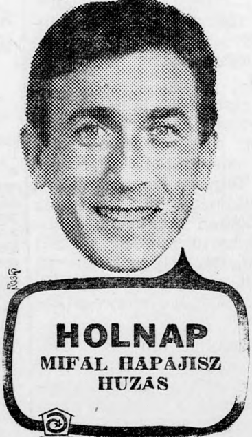
HOLNAP MIFAL HAPAJISZ HUZAS