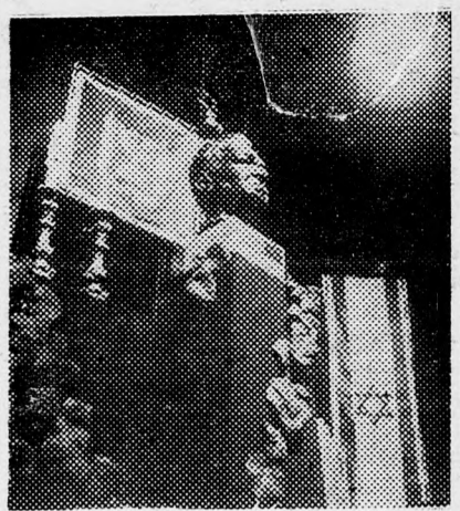
BEN CVI SZOBRA

Tegnap a délelőtti órákban az államelnöki házban gyászünnepi ünnepséget tartottak, délután 4 órakor pedig a Hár Hámencot-i temetőben a sírnál tartották az ázárát. Megjelent az államelnök, a miniszterelnök, a kormány tagjai, a család és számos közéleti személyiség.