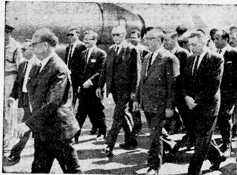
ADENAUER LUDDON A második sorban jobbról balra: Arje Levávi külügyi államtitkár, Lévi Eskol és Adenauer.

A repülőtéren renkívüli biztonsági intézkedéseket fogantatosítottak. A más gépekkel induló utasokat az