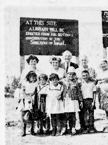
A MAGYARAJKU AMERIKAI ADOMÁNYOZÓK ÉS A CSAK HEBERÜL BESZÉLŐ SZABRAK

A Los-Angelesi Shelters nevű asszonyok csoportja, akik megköszönték az Amerikába elszármazott magyar-zsidó asszonyok ajándékát.