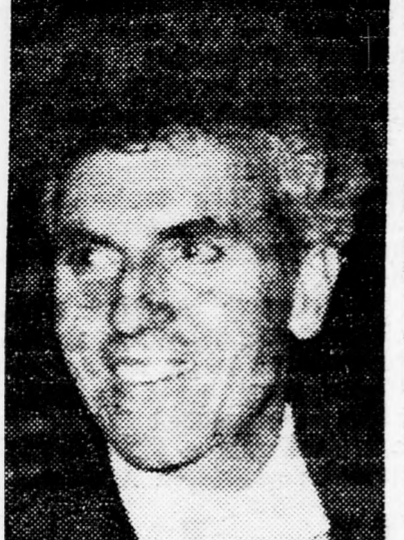
Éves párizsi születésű művész a francia fővárosban él, de rendszeresen turnézik szerte a világon, mint csellista és karmester.

Egy évvel ezelőtt a híres csellista és zeneszerző rövid időt töltött a gálili Máábárot kibucban. Ott szerezte „Izrael” című szimfónikus alkotását, amelyet vezénylete alatt a filharmonikus zenekar aztán előadott. Az 52