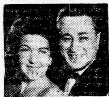
„Der färlibter nár”

(HÁAREC, független polgári napilap). — Mose Dájánnak két izraeli lap részéről való dél-vietnámi küldetése ellen különösen egyes baloldali körök tiltakoznak erősen. Attól tartanak, hogy a kommunista hatalmak ebben az izraeli kormány egyoldalú beavatkozását fogják látni. Dáján azonban ma nem miniszter és nem is kormánypárti képviselő, hanem az ellenzék tagja és így küldetése ellen nem lehet szót emelni. A külpolitika terén való ténykedés nem okvetlen a kormány monopóliuma, tudjuk, hogy az ellenzéknek francia politikusokkal való barátsága és a baloldali pártoknak a külföldi szélsőbaloldali megnyilvánulásokon való részvétele nemcsak, hogy nem ártott, de határozottan használt nekünk. Lehet, hogy Szaigon a Dájánnak adott beutazási engedéllyel arra is gondolt, hogy az ismert politikus és tábornok majd ismét aktív részt fog venni egyszer az izraeli kormányban, és sem lehet azonban akadálya annak, hogy a ma oppozícióban lévő Dáján tábornok egy tisztán szakmai küldetésben a vietnámi frontot meglátogassa.