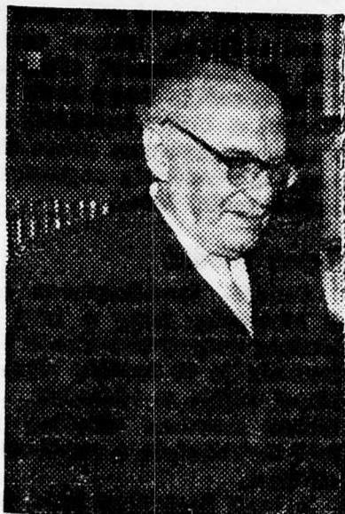
Abraham Sázár államelnök

Az államelnök jeruzsálemi szállásolására szolgáló díszes villát bocsátotta Sázár elnök és kísérete rendelkezésére. Uruguayból június 27-én repül az elnök és kísérete Chilébe, ahol július 4-ig tartózkodnak. Ezután kerül sor az argentinai látogatásra, amely háromnapos hivatalos programból és további ötnapos magánlátogatásból áll.