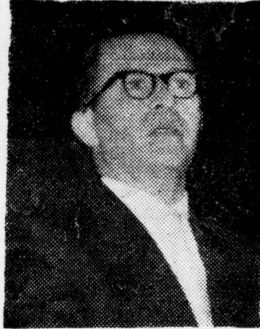
BEGIN Már régen elhatároztam

nagygyűlése kemény összecsapások színhelye lesz és nyílt kísérletek történnek