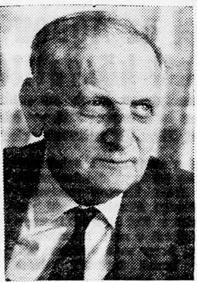
DAVID HOROVITZ — a műtét idejekorán jött

Az Állami Bank kormányzója, Dávid Horovitz, a televízió ipari és kereskedelmi kamara díszbédjén tartott beszédében kiemelte, hogy a gazdasági lassítás szükségessége az államháztartás hiányának mérsékléséhez vezet. Horovitz kiemelte, hogy a gazdasági lassítás szükségessége az államháztartás hiányának mérsékléséhez vezet.