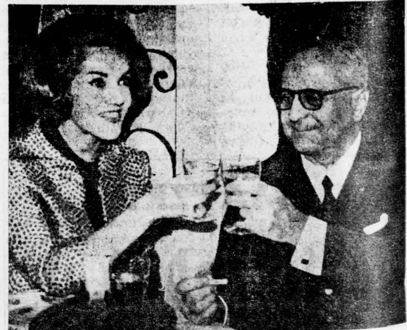
A 70 éves James de Rothschild báró fiatal feleségével. Az újdonsült báróné, szül. Yvette Choquet (27) azelőtt jegyesedő volt egy párizsi színházban.