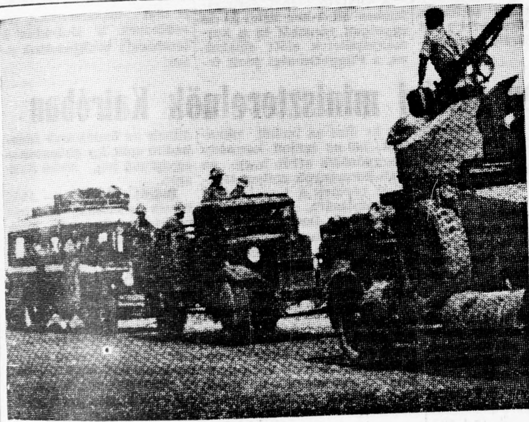
Autóbusz volt, csak autóbusz...

Jeruzsálem. (Az Uj Kelet tudósítójától). — Mose Peled alezredes, a légihaderő egyik vezető tisztjét a közlekedés- ügyi minisztériumba állam- titkárhelyettesnek nevezték ki, a polgári légiforgalom ügyei legfelsőbb irányításá- nak különleges megbízatásá- val. Peled a légihaderő neves harcpilótája, aki a többi kö- zött hangnál sebesebb gyor- saságú Mirage gépeket is ve- zettett. Peled az utóbbi két esztendőben egyetemen is ta- nult és Jeruzsálemben nem- zetgazdasági és államtu- dományi ismereteket szerzett.