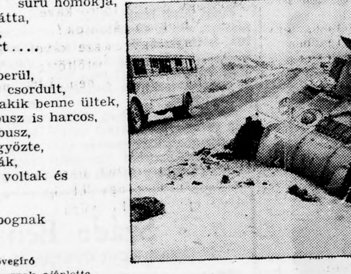
közleménye, a Szináj-hadjárat tizedik évfordulója alkalmából.

Nekifeszült az útnak emberül, Ajktá harapta, hogy vére csordult, S utasai — a katonák — akik benne ültek, Azt látták, hogy az autóbusz is harcos, Bajtárs lett az öreg autóbusz, Harcolt a homokkal s legyőzte, Váltig csodálták a katonák, Akkor tegnap még utasok voltak és Szűrték az autóbuszt, Csepülték, fitymálták, S ma mégis válltve robognak a közös cél felé!