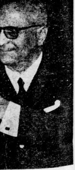
fiatal feleségével... (27) azelőtt zínházban.