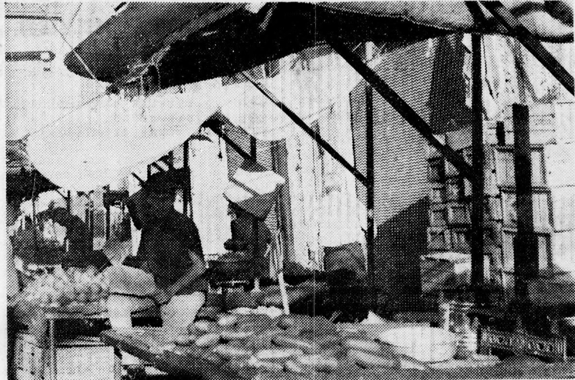
AKIKET NEM ÉRDEKEL AZ ADÓTEHER... A tel-avivi Karmel-piac zöldségárusai változatlanul kínálták az almát, az uborkát és a többi portékát

Lehetséges, hogy a kereskedők a tegnapi napot az évi szabadság számlájára fogják a.ami ekönyvelni, de a szak szervezet ezt is ellenzi.