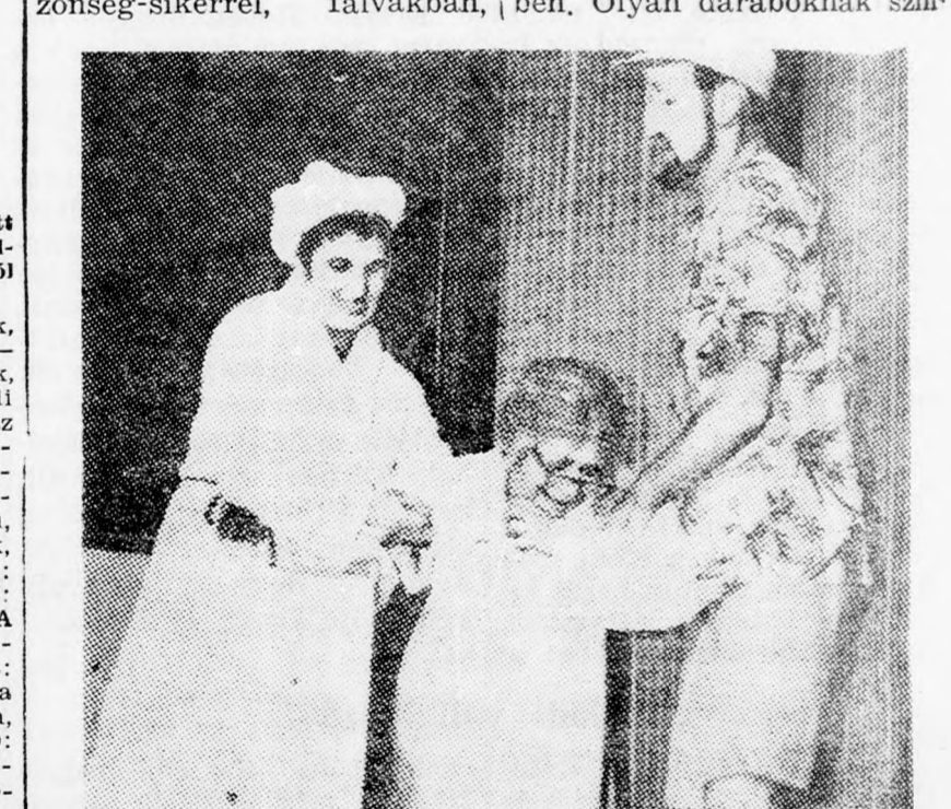
Jelenet a „Homokgödör” című egyfelvonásosból.

FARSZA (PATKO) kis színház: Egyfelvonásosok estje Néhány fiatal színész — mint pár héttel ezelőtt beszámoltunk róla — új színpadon próbálja ki erejét, roderen egyfelvonásosokkal. Karinthy, Ionesco, Tardieu, Edward Albee és mások szerepelnek az első műsoron. Tel-avivi bemutatójuk után az ország különböző színpadain lépnek fel, nagy közönség-sikerrel, falvakban,