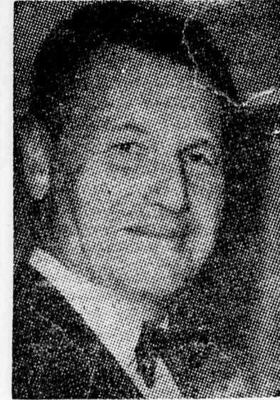
NELSON ROCKEFELLER Harmadszor győzött

lenére 44 mandátummal erősebben térnek vissza a képviselőházba és három to-