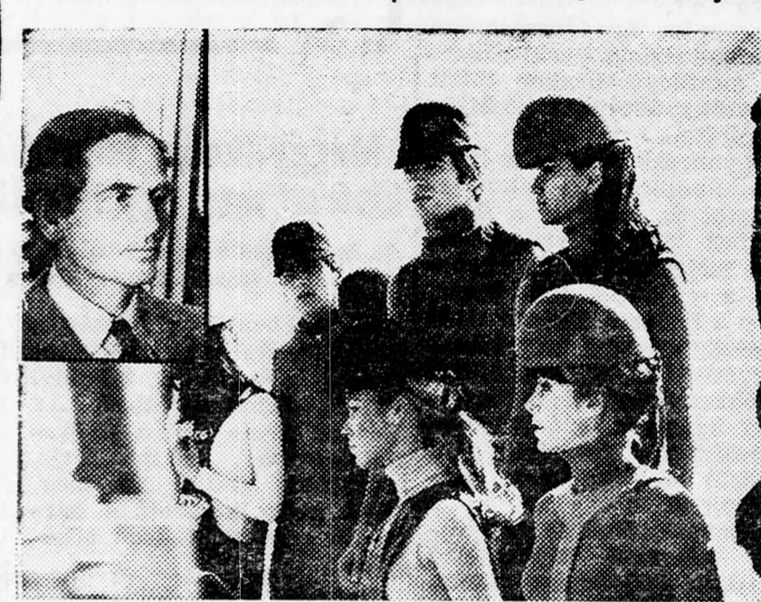
A CARDIN-LÁNYOK — A DIVATTERVEZŐ KREÁCIÓIBAN A kép bal felső sarkában Pierre Cardin látható

Tegnap este a világhírű párizsi Pierre Cardin divat- és a jeruzsálemi Izraeli Múzeumban bemutatta legújabb női és férfi kreációit. A főváros életében eseményzámba menő divatbemutatóra 35