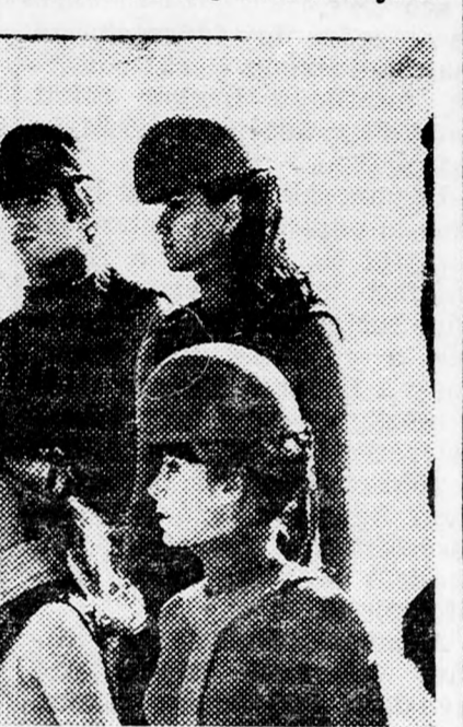
A CARDIN-LÁNYOK — A DIVATTERVEZŐ KREÁCIÓIBAN A kép bal felső sarkában Pierre Cardin látható

hogy a világ számos országában tartott már divatbemutatót. A többi között a japán királyi udvarban, valamint Ellisabeth angol királynő londoni palotájában vonultatta fel manekenjeit.