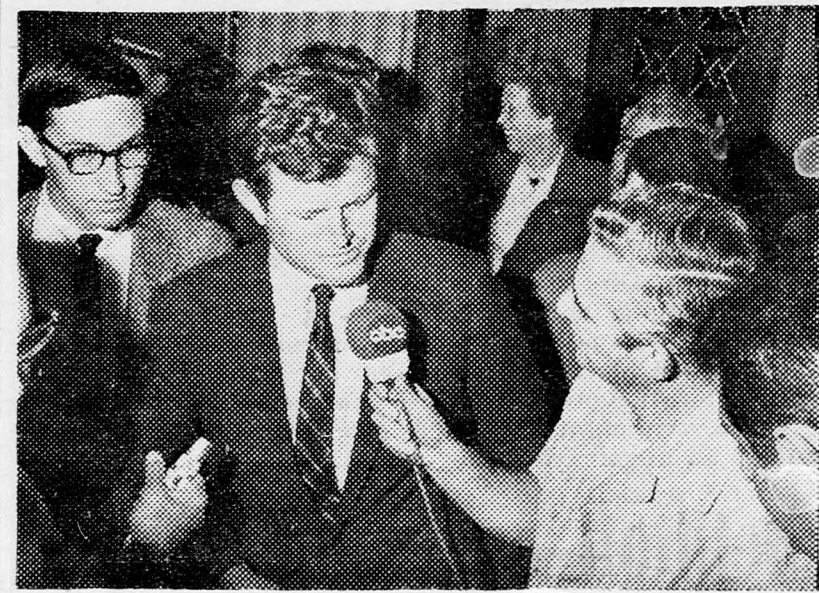
EDWARD KENNEDY Nyilatkozat a Mandelbaum-kapunál

és kísérete tiszteletére. A szenátor ma megtekinti a Kennedy emlékművet is, péntek