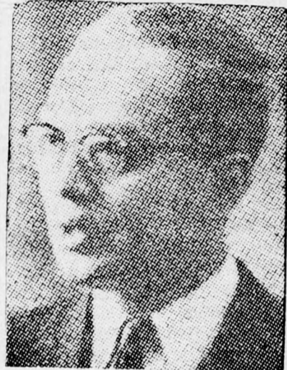
U TANT Több mozgási lehetőség a megfigyelőknek

óta szünetel a tanítás és tegnap meg kellett volna már kezdődnie, de a szerdán ki-