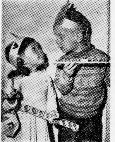
AZ OVODABAN Készülődés a chanukai ünnepélyre