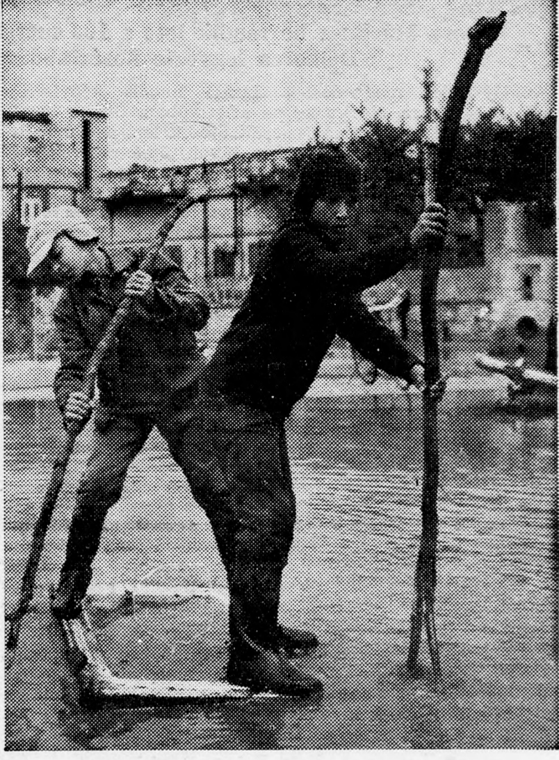
RÖGTÖNZÖTT „TUTAJON” KELNEK AT AZ ELÁRASZTOTT JAFFAI UTCAN