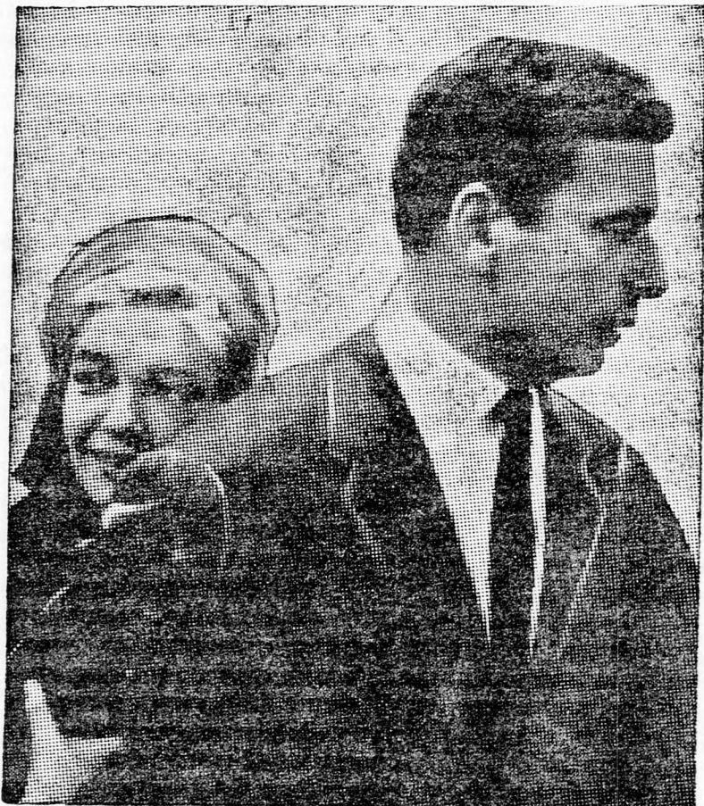
YVES MONTAND és felesége SIMONE SIGNORET

— Azt, hogy szerencsés ember vagyok. Nagybárára. Sok mindenért. És azért is, hogy ki tudom fejezni magamat énekekben és színészi