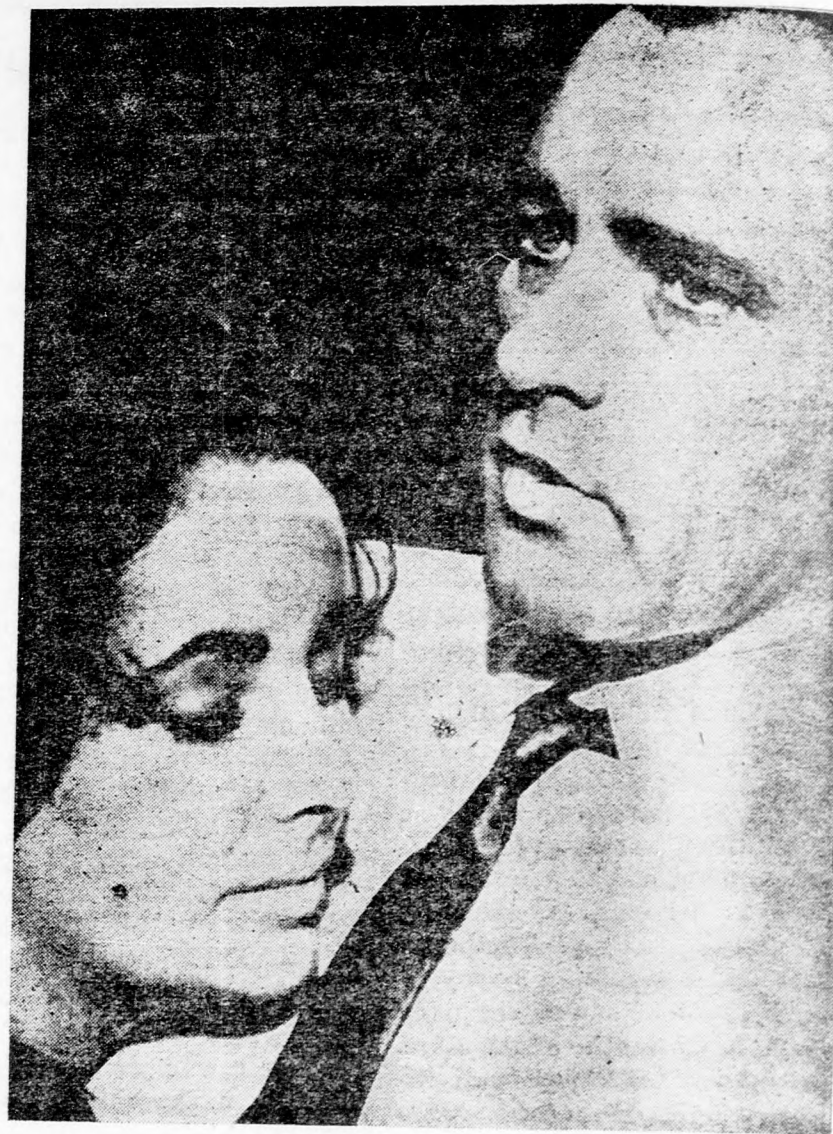
LIZ TAYLOR és R. BURTON

Liz Taylor egyik legújabb Amellett a folytonos kopla-nyilatkozatában arról beszélt, hogy nem helyesli a ő idegességük ráragad a fér- nagy fogyókúrázást. Mert jeikre, gyermekeikre is. Az véleménye szerint a fogyó- ilyen diétázó asszony háza- kúrázó asszony tönkreteszi szomorú.