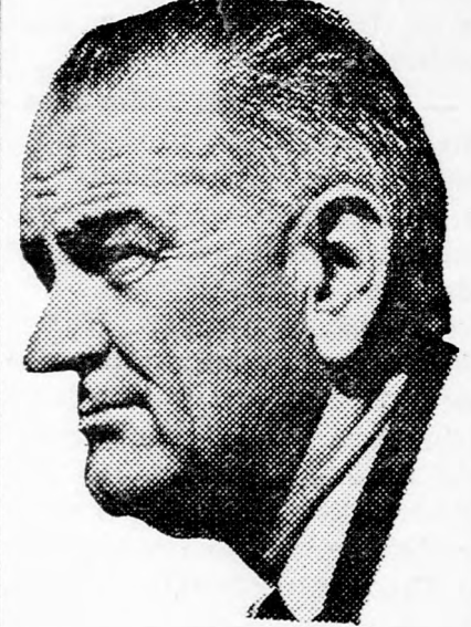
LYNDON B. JOHNSON a texasi vendéglátó gazda

San Antonio. (Reuter, UPI) Lyndon Johnson elnök tegnap San Antonio melletti Randolph repülőtérén várta Léví Eskol miniszterelnököt, aki feleségével és kíséretével az elnöki repülőgépen érkezett New Yorkból, hogy együtt in- duljanak helikopteren az elnök 120 kilométer távolságra levő birtokára és megkezdjék megbeszéléseiket az Izrael számára sorsdöntő jelentőségű kérdések sorozatáról. Amerikai körök véleménye szerint nem várható megállapodás repülőgép és fegyverszállításokról részleteiről, de feltételezik, hogy Lyndon Johnson garantálni fogja Izrael biztonsági szükségleteinek ellátását arra az esetre, ha az arabok fegyverkezése erősen felfut, és Izraelnek nem lesz más beszerzési forrása.