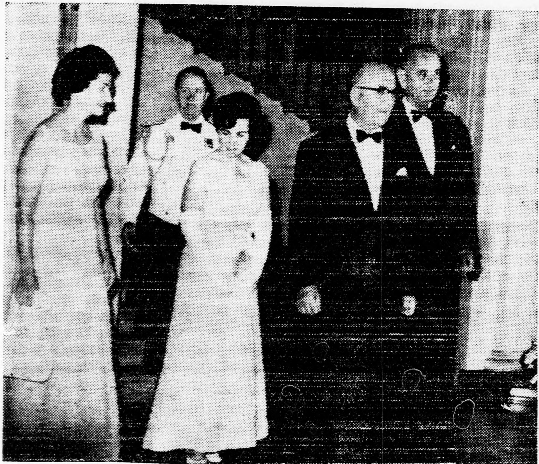
LÉVI ESKOL ÉS MIRJÁM, JOHNSON ELNÖKKEL ÉS NEJÉVEL (A felvétel a Fehér Házban készült Lévi Eskol 1964 évi washingtoni látogatásakor.)

kozott Arthur Goldberggel, az Egyesült Államok UNO-fődelegátusával. Goldberg emiatt