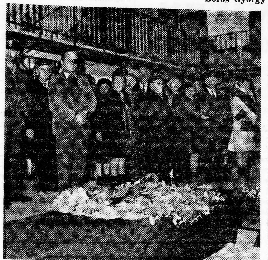
A GYÁSZOLÓ TÖMEG A FELRAVATALOZOTT KOPORSÓ ELŐTT. A kép balszélén: Ezer Weizmann tábornok, a hadsereg hadműveleti osztályának főnöke, mellette Mose Dáján tábornok hadügyminiszter