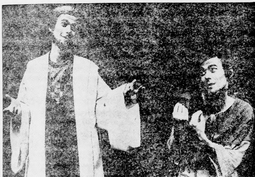
A „Salamon király és Salmáj, a cipész” nagy sikert aratott az olételepüléseken

A Kupát Cholim egyik igazgatója elmondja az Uj Kelet olvasóinak: