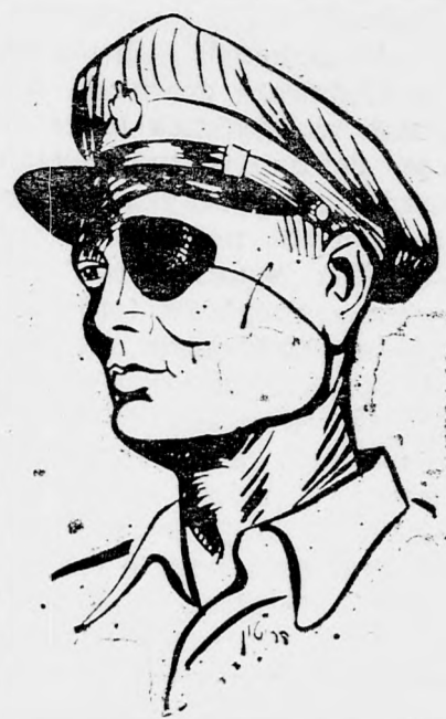
az oroszok a legkevésbé sem voltak biztosak abban, hogy esetleges közelkeleti beavatkozásuk, vagy fenyegetéseik nem okoznak nyílt és elkerülhetetlen összeütközést az Egyesült Államokkal. A határmenti helyzetről szólva Dáján azt mondta, (Folytatás a 7-ik oldalon)

A Szovjetunió és az amerikaiak közötti konfrontációról szólva Dáján azt mondta, hogy a Szináj háború idején, amikor az angol és francia hadsereg megtámadta Port-Szaidot, az orosz delegátus azt követelte az araboktól, hogy ne adják meg magukat. 1967-ben az oroszok nem tanácsolták az araboknak, hogy ne egyezzenek bele a fegyvernyugvásba. Az orosz álláspont és viselkedés változásának oka Amerikában rejlik, ugyanis