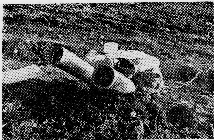
A bazuka csövei és benne a ki nem lőtt lövedékek, amelyeket Jád Cháná mellett találtak, amikor egy izraeli járőr három szabótört megölt.

és erőfeszítéseket tesz, hogy az észak-vietnámi kormányt tárgyalásokra bírja. Erre vonatkozólag Roman Pucsin-szki, az amerikai képviselőház egyik demokrata képviselője adta az információt és a Fehér Ház nem cáfolta meg. Ez a külföldi megbízott a Viet Kong legutóbbi