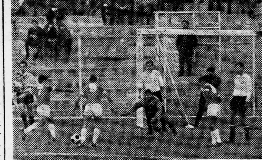
Néhány pillanattal az első gól előtt