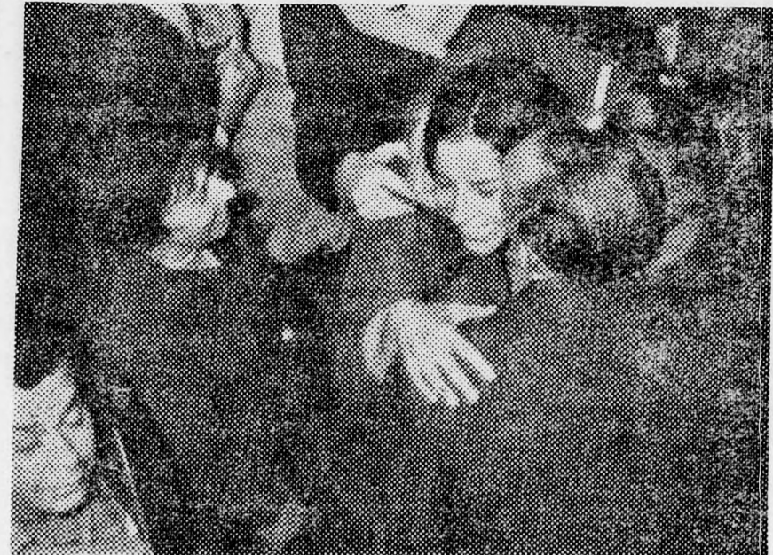
A szülők boldogan ölelik magukhoz a tragikus kirándulásról hazatért gyermekeket