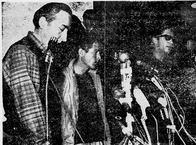
Szubach terrorista a mikrofonok előtt

A továbbiak során a szabotör elmondta, hogy az izraeli hadsereg akciója