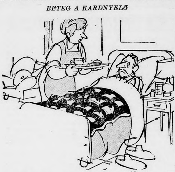
— Egy kis szöveget sem kívánsz?