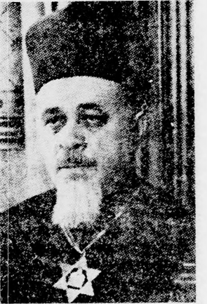
Vére jól emlékszik az erdélyi zsidóság abból az időből, amikor merész hangú szónoklattal ítélte el a zsidó üldözéseket és a deportálá- sokat.