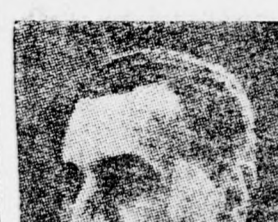
ABDUL NASSZER Elhozza a Krenlbe Szeze kulcsát?

— (HAAREC, független polgári napilap) — Rikidán nyílik alkalomunk, hogy állami izület dicsőjünk kizűvezését és eredményeier. Epp ezért kellemes kötelességünknek látjuk, hogy elismeréssel emlékezzünk meg az El-Al tevékenységéről, amely a racionalizálás példaképekül szolgált. Az 1967-68-as pénzügyi év magában foglalta a válság és a hatnapos háború idejét is. Azokat a veszélyeket, amelyek a vállalat tavaly április-július hónapokban szenvedett, pótolta a turisztikai aramlat és a fokozódó féltidegenforgalom.