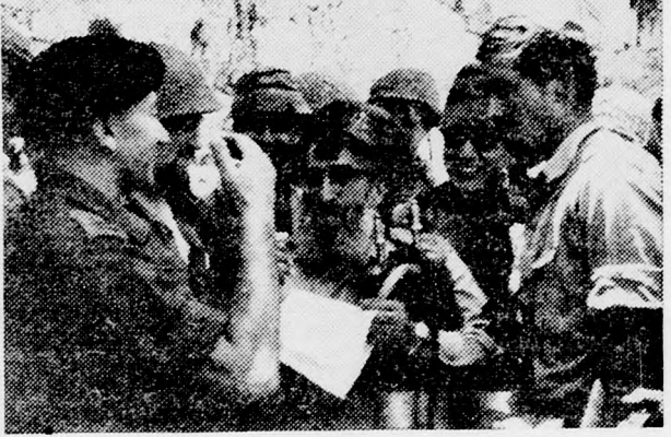
Goren tábornok, a hadsereg főrabbija a Nyugati Fal előtt a győztes „fluk” gyűréjében

Jeruzsálem volt az első város az országban, amely az aijja nyomán zsidó többségűvé vált. Már 1900-ban, az ottomán uralom alatt, 28.000 volt a zsidók száma Jeruzsálem 34.000 lakója közt. Evezredeken át vegyes volt a város: zsidók, perzsák, görögök, rómaiak, arabok, törökök, keresztények laktak benne. De mindig csak egy Jeruzsálem volt. Avrahám ősatyánk ideje-