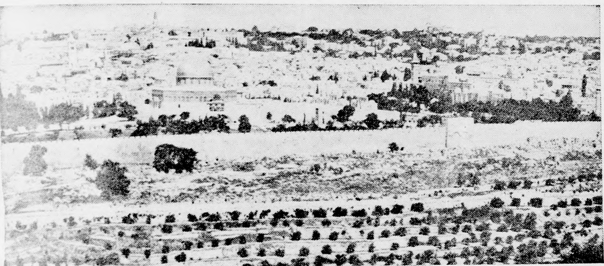
AZ EGYESITETT JERUZSALEM