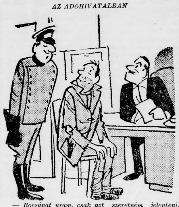
— Bocsnát uram, csak azt szeretném jelteni, hogy a Rolls-Royce-t elvittem a garázsba.

Egérpapa két csemetéjével sétára indult. Hirtelen gyanus nesz támadt. A macska közeledett. Egérpapa nem vesztette el lélekjelenlétét és elkezdett ugatni. A macska megijedt és elfutott. Kibűllesztett mellette mondta a macskapapa: — Látjátok, gyerekek, mennyire fontos, hogy az ember legalább egy idegen nyelvet tudjon. SZORAKOZOTT PROFESSZOR — Bocsnát, uram, meg tudná nekem mondani, hogy ki az a rettenetesen csúf nő, ott a zongora mellett? — De professor úr, hiszen az az ön felesége. — Mindjárt tudtam, hogy valahonnan ismerem. SZERELEM Az első táncstén egymásba szeretnek a fiatalok. — Mondja a lány: — Drágám, amíg élek, szeretni foglak. Soha nem engedlek el messzire tőlem, mindenhol veled megyek. — Ez nehéz lesz. Ugyanaz pilóta vagyok.