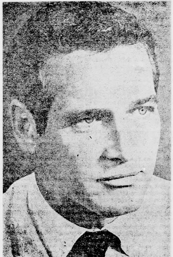
Mégsem hagyta abba. Kiváló sportoló. Valaha úgy volt, hogy bekerült az amerikai futball-válogatottba. Azután szerencsére megsérült a térdje és nem lett hivatalos labdarúgó. Nem tudja milyen meghívást nem fogadna el.