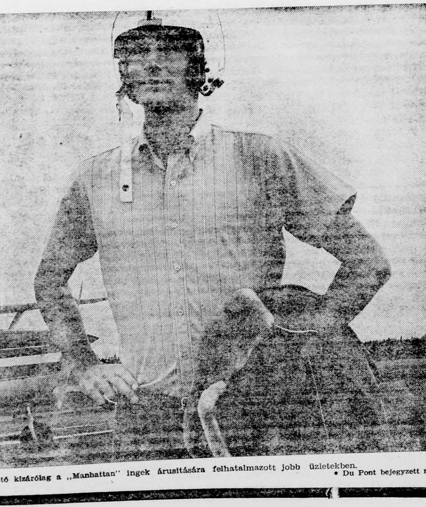
Kapható kizárólag a „Manhattan” ingek árusítására felhatalmazott jobb üzletekben. Du Pont bejegyzett név.

„Manhattan” az ing-siker. Most érkezett Izraelbe és máris az év „sikere”. A szezon a „Manhattan” ingek számtalan, élénk, szemlépráztató színében fog ragyogni.