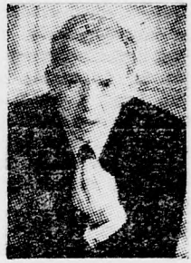
COUVE DE MURVILLE