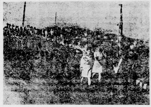
Utolsó főpróba az indulás előtt — Hollandiában is dalolva menetek az izraeli katonák és katonalányok

A távgyaloglás kedden kezdődik és négy napig tart. A csoportba, amely Izraelt képviseli Hollandiában, nem volt könnyű a bejutás. Az egyesek legjobb katonáikat választották ki, ezeknek egy különbizottság igen szigorú szűrővizsgálatot kellett keresztülniük, ahol nemcsak gyakorlati képességüket, hanem intelligenciájukat, megjelenésüket, idegen nyelvtudásukat és hasonlót is vizsgálták. A résztvevők között számos olyan katonája van, aki a hatnapos háborúban, vagy más katonai akcióban tűntette ki magát. A 150 jelölt közül kiválasztott 51 gyalogló igen komoly edzésen és előkészítő tanfolyamon ment keresztül Szarig alzredes irányításában.