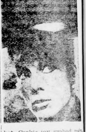
ket. Csakis így szabad menni. Nem bírom azokat a embereket, akik állnak azon jajongni, hogy ez az, vagy az, a helyes út, milyen rosszul jártak.