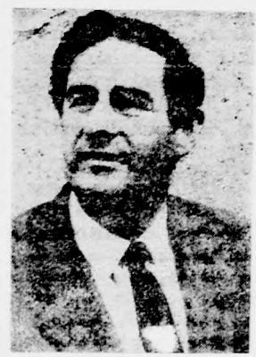
Menotti kerüli az újságírókat és azt mondják, nem is akart résztvenni a színházra rendezett sajtótudósításban.