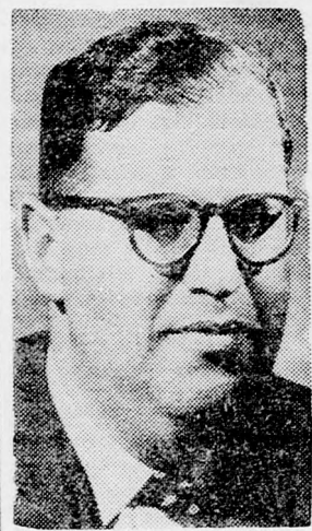
EVEN Területekről nincs szó

várható állásfoglalásáról. A 125 tagállamból álló világ-szervezetben jelenleg — mon-