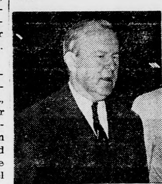
PEARSON Először Izraelben

pével és néhány napos izraeli tartózkodása alatt szintén a Weizmann-intézet vendége lesz.