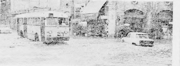
Jaffán helyenként fémter magasságot is elért a víz. Képünk egy jaffai utcáról ábrázol, amely gyalogjárók számára teljesen járhatatlan

A tegnapi szüntelen esőzés súlyos forgalmi zavarokat okozott az ország különböző részeiben, különösen a peremvárosokban. A korábbi órákban rendkívül nagy fennakadással és késésekkel bonyolódott le a közúti forgalom ebben a körzetben, mert Tel Aviv déli részében teljesen elöntötte a víz az utcákat és a közutakat. A rendőrség közölte, hogy további intézkedésig lezárták az utakat Cholon és a tengerpart, illetve Ezra Ubi cáron és a tengerpart között.