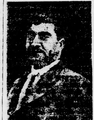
— A kurd felkelők leköltik a bagdadi kormány teljes katonai erejét, és Izrael ellen sem mit sem tudnak tenni.

Bárázáni most elkeseredetten nyilatkozott az elmúlt tíz esztendő arab kormányairól: — Valamennyien hazudtak s csak ígérték nekünk a kisebbségi jogokat. Közben elnyomták a kurd nemzetiséget. Jelenleg 60 ezer katonát állít velünk szembe a bagdadi kormánynak, és Izrael ellen sem mit sem tudnak tenni.