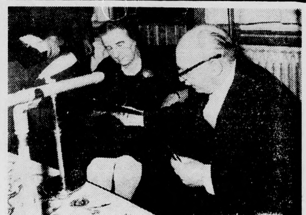
SÁZÁR ELNÖK MEBBIZZA KORMÁNYALAKÍTÁSSAL GOLDA MEIRT