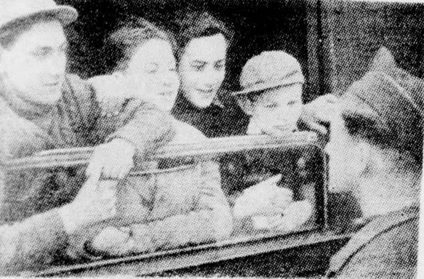
ALIJJAZNAK A BERGEN-BELSENI GYEREKEK Egy évvel a szabadság után, 1946 tavaszán indult el az első gyermek-alijja a belseni peronról.

Két évig állott üresen a barakkbort. Csak azután rendezték be szablyszerű KZ-nek. Az a véletlen folytán életbenmaradt áldozat. He-