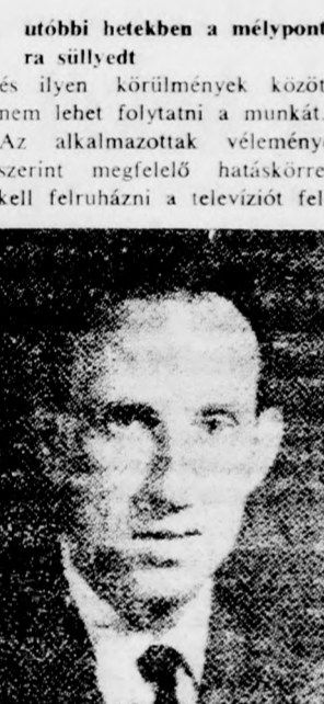
KATZ PROFESSZOR „Igy nem mehet tovább!”

A dolgozók közleményét is ki- bocsátották, amely hangsúlyoz- za, hogy a helyzet a televízióban az