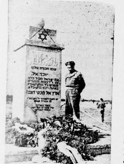
BERGEN-BELSENI MÁRTIROK EMLÉKMŰVE A zsidó brigád katonája az emlékműnél.

Vallottak a fűszereplők és vallott néhány, azután rendezték be szablyszerű KZ-nek. Az a véletlen folytán életbenmaradt áldozat. He-