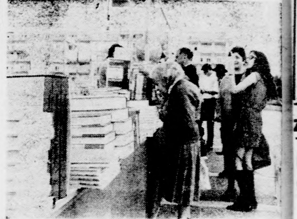
TEL-AVIVBAN AZ EGYIK KÖNYVELÁRUSÍTÓ HELYSÉGE

Több ezer könyvet árusítanak — 40 százalékos engedménnyel. Tegnap nyílt meg a héber a Jeruzsálem-fasor és a Dettar könyvház, amelynek keretében Slomo sarkán, míg Haifaán sok ezer könyvet bocsátanak Benjámin-parkban és Beér árusításba 25-40 százalékos van a Bet Háam pavilonban.