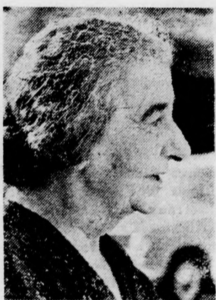
GOLDA MEIR Újabb békefelhívás

A miniszterelnök a Ház nyári ülésszakának megnyitóján ismerteti álláspontját — „Nem ígérhetem a közeli nyugalmi állapotot, de biztosan számíthatunk hadseregünkre” — „Fenyegetések és nemzetközi nyomás nem térítenek el utunktól”