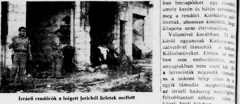
Izraeli rendőrök a leégett Jerichó üzletek mellett

A Jerichó ellen intézett támadás következtében megsebesült egy helyi arab rendőr, aki szolgálatát teljesítette, három üzlet leégett a bennelévő áruval együtt, két további üzlet pedig megrongálódott.