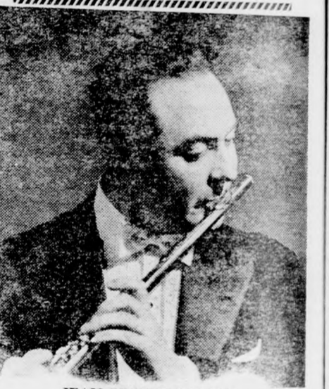
JEAN PIERRE RAMPAL