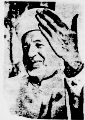
gyarjazta chevroni vendégeinek, hogy

„Számomra ti vagytok a legjobb bizonyíték arra, hogy a zsidók, s ennek az országnak arab lakói között lehetséges a béke és a jószomszédtság, sőt minden tekintetben áldásos a két népre nézve. Ezek után szentül hiszem, hogy elérkezett a béke napja és ebben a hitemben megérősít a ti áldozatkész és sikeres munkátok” — mondotta Michamed Ali Dzsáabri sejk, chevroni polgármester, amikor látogatást tett a Zichron Jákov közelében levő Furajdisz nagy arab faluban.