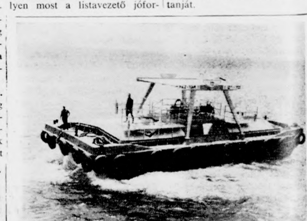
„Paz-Jam 1” — Ez a neve az első, Izraelben újszerű vizijáróknak, amelyet arra használnak fel, hogy az éjjeli kikötőben horgonyzó hajókat olajjal lassa el. A „Paz-Jam 1”-et a héten bocsátották vízre Ejlathban. A vizijáróvet a Paz köolajárság állította üzembe.