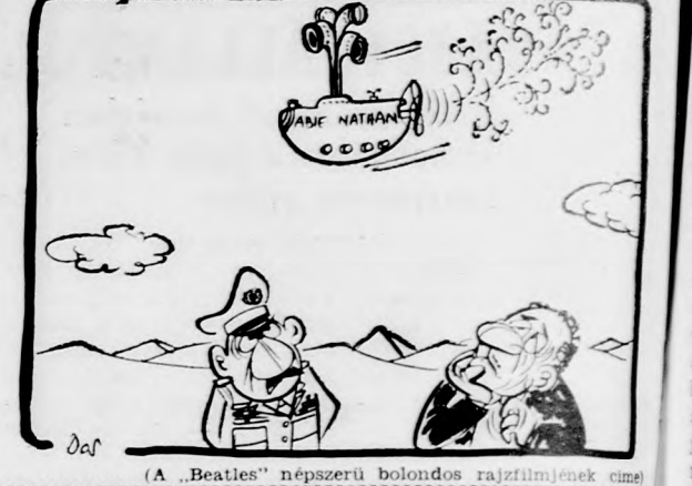
A „Beates” hírszerzői boldogul riasztották az Egyesült Államokat

NIXON: Az egész világ félelemben élne, ha Amerika hátát fordítana szövetségeseinek Az elnök támadta azokat, akik gyors vietnami békét és egyoldalú leszerelést követelnek