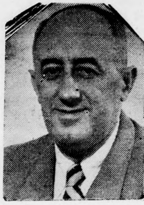
Államunk nem vitás, hogy a legnagyobb eréllyel fogunk válaszolni.

Béke és a biztos határok nélkül egyetlen katonánk sem fog elmozdulni a jelenlegi tűzszünetes határokról. Minden agresszióra és terrorista támadásra a legnagyobb eréllyel fogunk válaszolni.