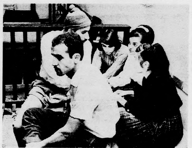
AZ ÖT VADLOTT

Természetesen valamennyi vádlott tagad és a már hagyományossá vált módon azzal vonja vissza a rendőrségen tett beismerő és társait terhelő vallomását, hogy azt „kinzásokkal csikarták ki”.