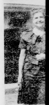
TAKARÓ GÉ... REFORMÁTUS

A VÉSKÖ... Szem nem ma... Mincha-ima után