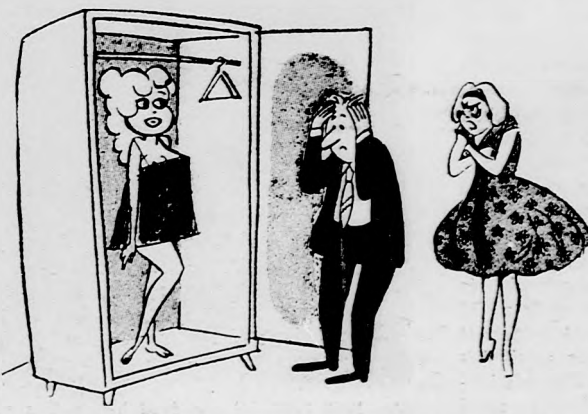
— Most próbáld csak meg az ócska kifogással, hogy a lány autóbuszra vár.

IRUACH VN Helyreállítás üdülő ország minden részénélkül. HAIFA: Herzl u. 22., TEL-AVIV: Allenby 113., NATANIA: Herzl utca 4.,