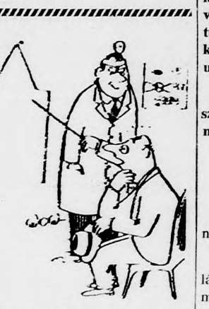
Az orvos: Nem lát egyetlen egy betűt sem?! Akkor nagyon hosszú és költséges kezelésre van szüksége.

— Hogyan szerzed ezt a bájos asszonyt? — Hidd el, komám, hogy merő véletlenség az egész. Fűtültem egy taxiért, és ő érkezett előbb.