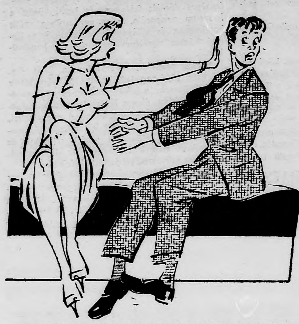
— Amint egy kicsit közeledek hozzád, azt mondom, hogy túl messzire megyek.