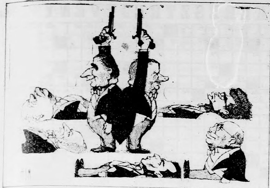
VIGYAZZ!... KESZ!!!... RAJT!... (L'Express)