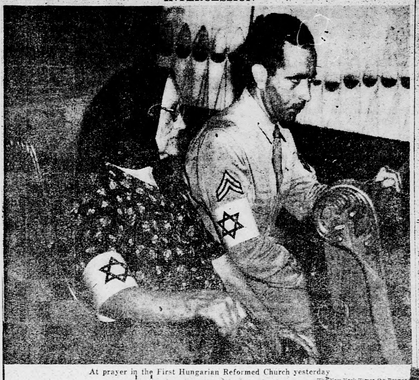
At prayer in the First Hungarian Reformed Church yesterday

NEW ARGENTINE ARMS, R.29 HITS INDICATED | ROOSEVELT THANKS