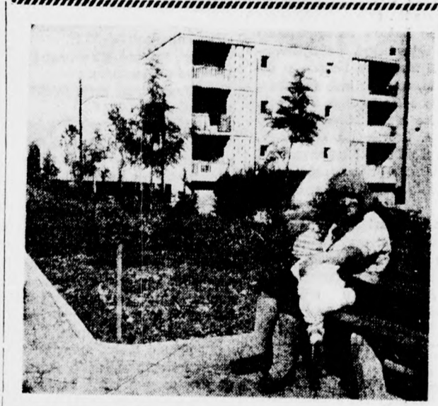
RAMLAN SZERETETTEL VÁRJÁK AZ OLEKÁT

Amerikának az a kísérlete, hogy a Szovjetunióval egyetemben (Anglia és Franciaország 1969 VI. 13. Uj Kelet 3a