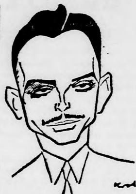
HUSSZEIN Fiet-halál harc?

Felviszi a harcot a terrrorszervezetekkel? — Nagyatyját nevezte ki vezérkari főnöknek