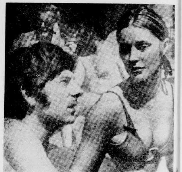
Az utolsó közös kép. Roman Polansky és Sharon Tate

Roman Polansky baráti köre, Peter Sellers, Yul Brynner, Mia Farrow, Julie Christie, Warren Beatty és mások 25 ezer dolláros díjat fizettek ki annak a személynek, vagy csoportnak meg-