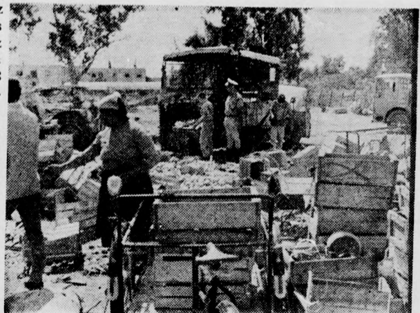
Atak azonban közelbéltek és megakadályozták az önbíráskodást. A rendőrség letartóztatott ruzsálemben az állami nyomda épülete mögött, de senki sem sérült meg.