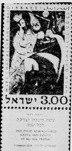
„Dávid-király” című festményt ábrázoló bélyeg, amelynek

DAVID-KIRÁLY BÉLYEG Izraelben az ősz folyamán a Mark Chagall