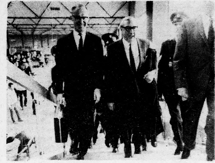
GEORGE BROWN MEGÉRKEZIK LUDDRA

Golda Meír miniszterelnök tegnap jeruzsálemi irodájában fogadta George Brown, akinek tisz