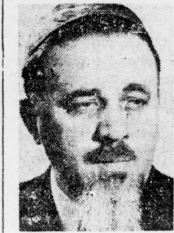
ROZÉN FŐRABBI „Ebred az ifjúság!”

A romániai zsidóság helyzetéről szólva elmondta, hogy a százezer főnyi zsidóság java része az idősebb korosztályhoz tartozik. Hetvenöt szervezett hitközség fejt ki tevékenységet a romániai zsidó hitközségek federációja keretében, amely fő feladatának a zsidók érdekeinek képviseletét tekinti. Azt is elmondotta a főrabbi, aki a zsidó világkongresszus összevont tősegű ülése alkalmából jött is-