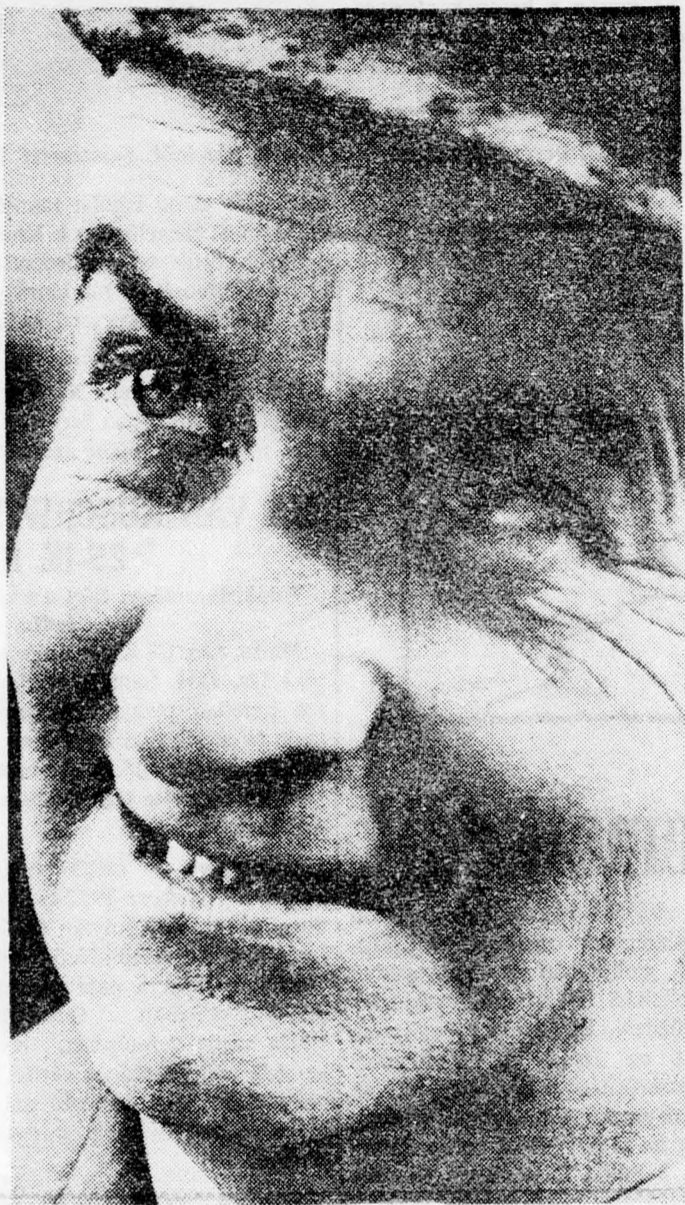
LOUIS DE FUNÈS

vet ahhoz, hogy mást tegyen? — Nem. Szerettem megnevetetni az embereket. Bár tökéletesen sikerülne, mint ahogyan sikerül. — Vágyik arra, hogy Franciaország egyszámú komikusa legyen? — Sohasem vágytam a csúcsra. Olyan foglalkozást űzök, amit szeretek, ami lelkileg kielégít. Mindig, mint kezdő színész is, nagy súlyt fektettem még a legapróbb szerepre is. Mindenkor úgy éreztem, hogy minden azon az egy lapon forog. Pedig a kutya sem figyelt fel rám. Ilyen a természetem. Amit csinál, abban hiszek. Most a humorban. Abban, hogy az embereknek szükségük van a nevetésre. Legalább annyira, mint az ételre. És ez sommás megállapítás egy olyan ember részéről, aki sokat éhezett. Nem tudom, hová vezet még a pályám. Rövid idő alatt híres lettem és jómódú. Ha ma kellene valamilyen ok miatt abbahagyni, akkor is biztosan volna már egész életemre, hogy jómódban élhessek. Ez nagy dolog, mert sok aggodalmam volt a jövőm miatt, féltem az öregség napjaitól, attól, hogy a társadalom zordságára leszek ráutalva. És talán nem volt hiabavaló mindaz, amit eddig tettem, ha sikerült jó órákat adnom szomorú, sok gondtól, bánattól nehéz lelki embereknek. Ezt a küldetést még sokáig szívesen végezném.