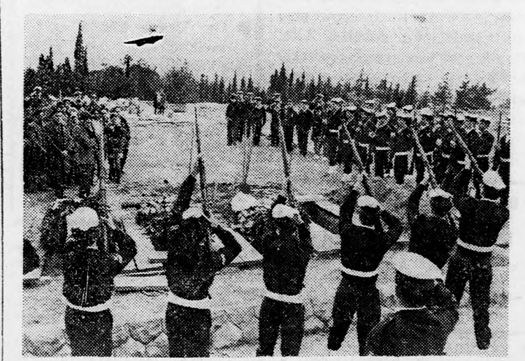
Diszlovések a nyitott sírok felett Kirját Saul temetőjében

Nemcsak a Mápám, hanem ugyiszólván valamennyi nemvállásos pártban erős ellenzék alakult ki a javaslatokkal szemben, azon az alapon, hogy a kormány rossz példát statuál, ha nem tesz eleget a Legfelsőbb Bíróság döntésének, hanem kibúvót keres annak megkerülésére. Ezt a felfogást főleg a Független Liberális Párt képviseli. Ezek a körök egyébként éppen a status quo megsértését látják a Nemzeti Vallásos Párt követelésében.