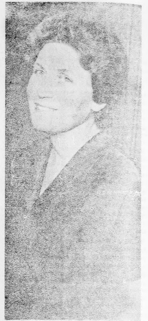
Kezélő káluzra tartozik. Ha Chester Bowles telefonál, hogy föltessem a hét végét náluk, sok- száz kilométerre tölem, megveszem a repülő- jegyemet és már indulok...”

Ha felülök itt egy autobusra és mondjuk New Yorkba utazom, ez csak rám és a jegy-