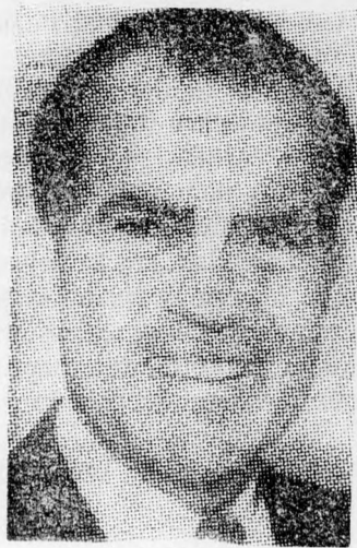
NIXON Tél után tavasz...

Üzenete végén az amerikai elnök hangsúlyozta, hogy az Egyesült Államok eltökélt szándéka, hogy hozzásegítse a Közel-Kelet népeit szűbb, békés jövő kiépítéséhez. Hiszem — írja az amerikai elnök —, hogy minden amerikai