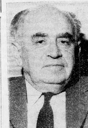
SAPIRA miniszter Ezt nem lehet a Kneszetben ...