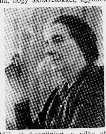
GOLDA MEIR: „Tűzbeszűntetés csak kölcsönösség alapján”