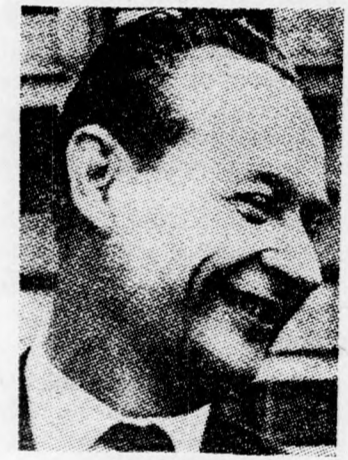
DUBČEK Hűsülés Ankarában