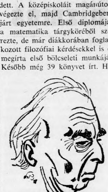
rem évekkel ezelőtt emlékiratait is közzétette.

Izráel és a zsidóság kérdéseit mindig élenk foglalkoztatták Bernard Russelt. Már 1963-ban felemelte szavát a Szovjetunióban mutatkozó antiszemita jelenségekkel szemben. Egy zsidó vádolt ügyében hozott halálos ítélet elleni tiltakozásul, dühös hangú levelet írt Nikita Chruscsevnek. — 1963-ban az arab-izráeli tárgyalások mellett tört lándzsát, és azt javasolta, hogy Izráel mutasson jószándékot és legyen kezdeményező ebben az értelemben, hogy megteremtődjenek a tárgyalások feltételei. Egy hónappal később rendkívül aggodó hangú levelet intézett Izráel és az arab országok miniszterelnökeihez, kifejezve, hogy véleménye szerint mennyire borotvaéles a közelkeleti válság.