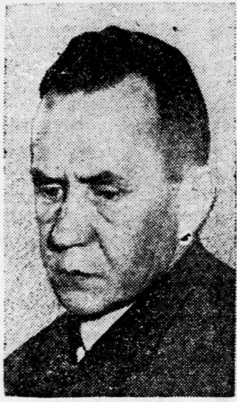
ALEXEJ KOSZIGIN meg akája menteni Nasszert

London, (Reuter). — Aharon Remez, Izrael londoni nagykövete látogatást tett az angol külügyminisztériumban, ahol a külügyminiszter parlamenti titkárnak helyettesével találkozott. Remez nagykövet rövidesen Izraelbe repül tanácskozársra. A nagykövetség köréből rámutatnak arra, hogy Remez megbeszélését a sokkal ezelőtt előkészítették és semmi kapcsolata sincs Alexej Koszigin Harold Wilsonhoz intézett jegyzékével. A külügyminisztérium körében hangsúlyozták, hogy sürögnek tartják a közelkeleti probléma magas diplomáciai fokon való tárgyalását, hogy megakadályozzák a helyzet elmeresedését és valószínű, hogy erre vonatkozólag a nagykövet is közlést kapott.