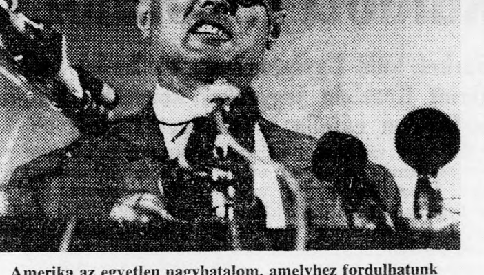
Amerika az egyetlen nagyhatalom, amelyhez fordulhatunk

„Nincs szó arról, hogy „izraelizálni” akarjuk a területek lakosságát, de igenis minden erőfeszítést meg kell tennünk ahhoz, hogy további zsidó települések létesüljenek a területeken. Ezzel együtt továbbra is fenn kell tartanunk