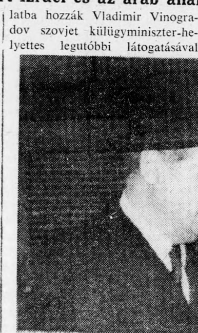
U Tant és Jarring az UNO központjában

Bunche-nek ez a megjegyzése valószínűleg a franciákra vonatkozik, akik a szovjet delegátus előadásában kedvező fordulatot