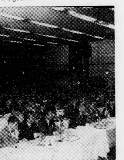
Az IFALPA konferenciájának 250 delegátusa a megnyitó beszédet hallgatja. (UPI, rádiófoto)

A konferenciát G. Roberts angol kereskedelmi miniszter-helyettes nyitotta meg. Kijelentette, hogy a törvényes rend betartása a polgári repülés terén mindenkinek fogaadandó kötelessége, aki ezzel a fontos közlekedési ággal kapcsolatban van. Emlékeztetett a Swissair repülőgépek felrobbantására, amely 47 ember halálát okozta. Felhívta a figyelmet arra, hogy