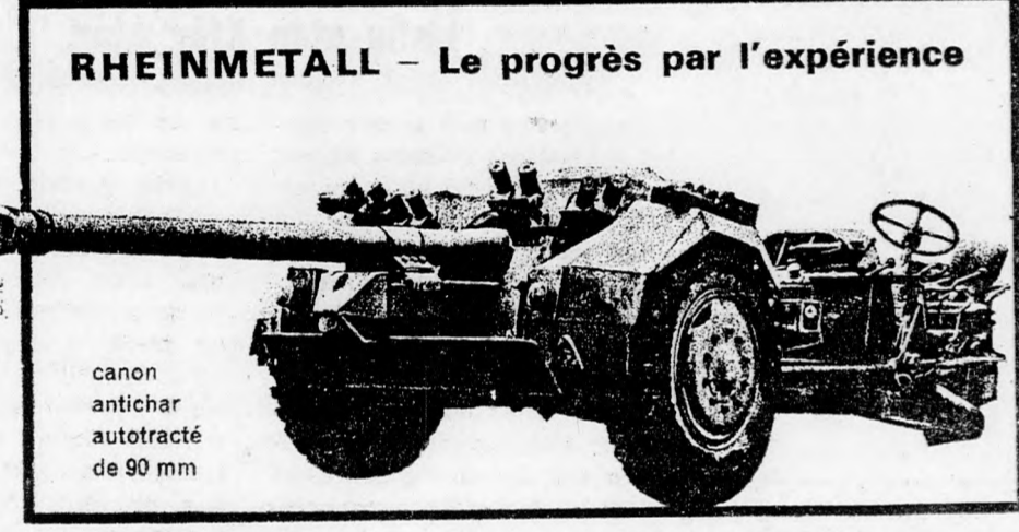
RHEINMETALL - Le progrès par l'expérience

ezt a „Chinook” helikoptert ábrázolja, amelynek személyzete egy lebombázott vietnámi falu asszonyait és gyermekeit evakuálja, sőt a humánus katonák karkával kínálják a gyermekeket. És így tovább. Túlzás lenne azt állítani, hogy a fegyvervásárlási bizottságok