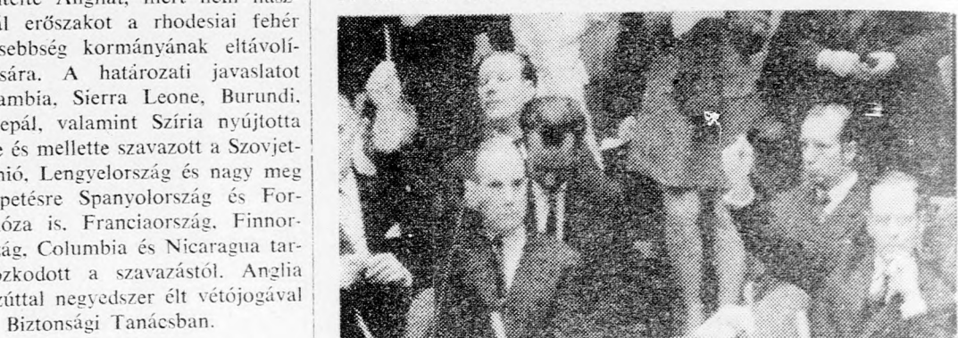
Charles Vost amerikai delegátus vétőt emelt a BT határozata ellen. Tőle jobbra Lord Caradon angol megbízott emelt fel kezét a vétőjogát.

New York (Reuter, IFP, UPI). Az UNO 25 éves történetében első alkalommal az Egyesült Államok vétőt emelt a Biztonsági Tanács határozata ellen, amely elítélte Angliát, mert nem használta erőszakkal a rhodesiai fehér kisebbség kormányának eltávolítására. A határozati javaslatot Zambia, Sierra Leone, Burundi, Nepál, valamint Szíria nyújtotta be és mellette szavazott a Szovjetunió, Lengyelország és nagy meglepetésre Spanyolország és Formóza is. Franciaország, Finnország, Columbia és Nicaragua tartózkodott a szavazástól. Anglia ettől negyedszer élt vétőjogával a Biztonsági Tanácsban.