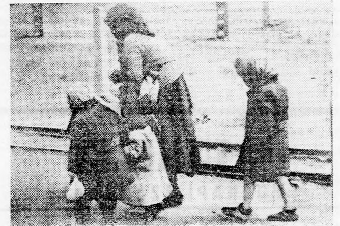
UTBAN A GÁZKAMARA FELÉ: A NAGYMAMA UNOKÁIVAL

1943-44 telén zsidó körökben egyre bizakodóbb lett a hangulat. Olaszországban szövetséges hadak kiűzték, az