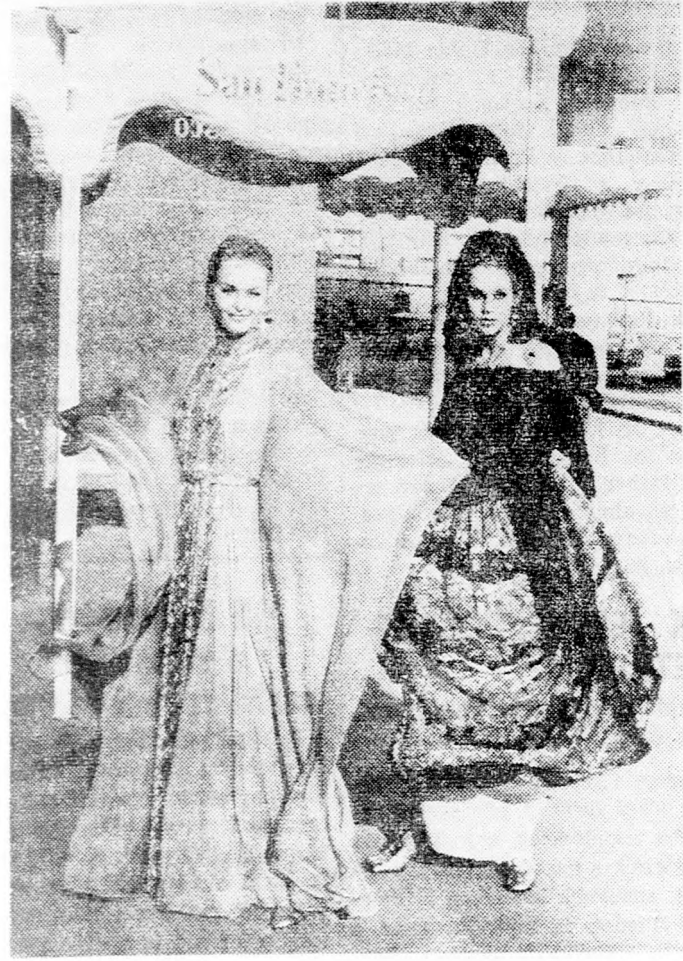
A „cigány-modell” ebben az évben nagy népszerűségnek örvendek. A párizsi divatcégek egymásután készítik el az újabb kreációkat. A képen látható szöke hölgy, Miss Délafrika, szintén az egyik cigány-modell viselője.