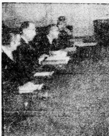
Képünkön a holland külügyminiszter (balról a második) tanácsadóival tárgyalást folytat az egyiptomi külügyminisztérium embereivel (az asztal túlsó oldalán)

Joseph Luns holland külügyminiszter, aki látogatást tett Libanon, Jordánia és Egyiptom fővárosaiban, tegnap este, közkeletű körúti utolsó állomásáról, Kairóból