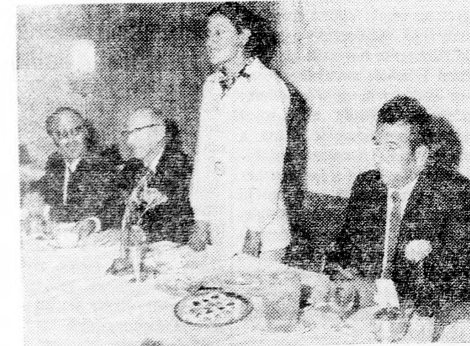
A nagyközönség teljes megértését kéri...

„Tétöt a visszamaradt gyermeknek” jelszavával indul be április nyolcadikán az „ÁKIM”