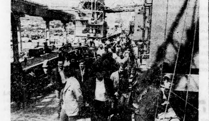
Leendő tengerészek a „Hár Szináj” fedélzetén

tartott előadást a Technion diákserege előtt és ennek során mesélte, hogy nemrégiben találkozott El Aris idős polgármesterével, aki miután letárgyalta a napirenden szereplő aktuális kérdéseket, elpanaszolta, hogy „igy sem volt jó, ugy sem volt jó...” Kutyaeletünk volt az egyiptomiak alatt — s óhajította a muktár. — Kegyetlenül zaklatták, megadóztatták a népet, de a közszolgálatokkal nem törődtek és panaszunkat mehetünk a sőhivatába. Az izraeli hatóságok emberségesen bának velünk, meghallgatják panaszainkat, sőt orvosolják is és nem terrorizálnak le, mint az egyiptomiak. De mégis félek a nyílt együttműködéstől, mert mi lenne velem, ha az izraeliek ismét kivonulnak és visszajönnek az egyiptomiak?