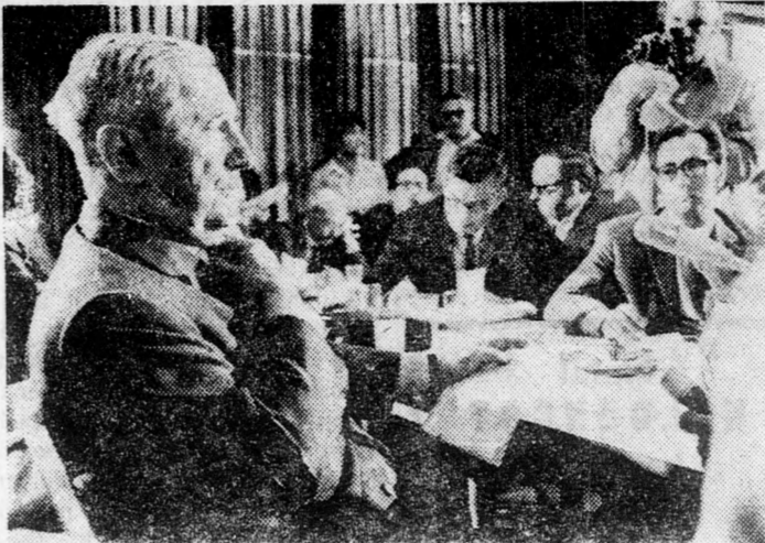
Dr. Náchum Goldmann a Bét Szokolov újságíró-székhat konferenciatermében

Dr. Goldmann ezalkalommal hozzátette, hogy a Nasszerrel való találkozó nem ő kezdeményezte, hanem egy bizonyos állam nagykövete utján juttott el hozzá az értesítés, hogy Nasszer két feltétel mellett, elvben hajlandó lenne mérlegelni megjegyzett, hogy egy alkalom-