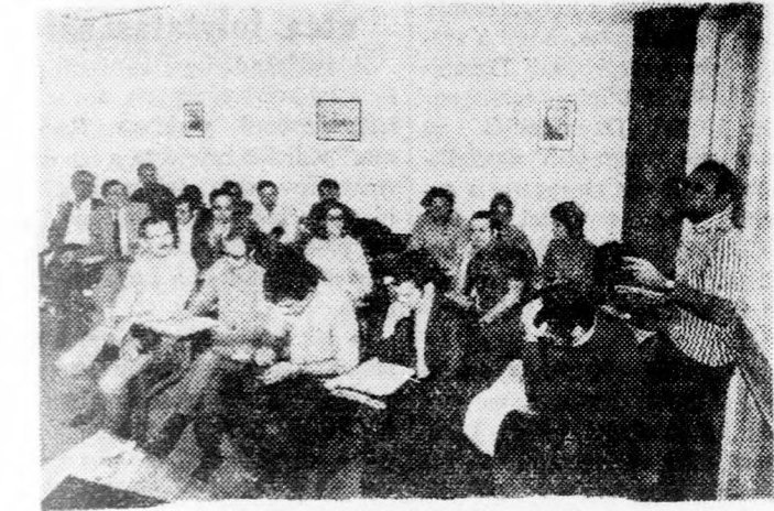
Az új francia ifjúsági alijja vezérkara

részvett a Szochnut tiz napos szemináriumán és helyszíni tájékoztatást kapott az alijja-klita-sikun-biztonság és... a tájékoztatás aktuális problémáiról.