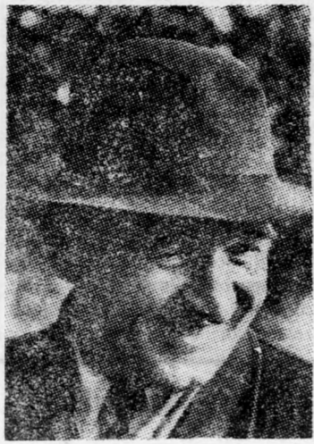
GRIGORENKO De kicsoda „normális”?

A bátor oroszok között, akik nyíltan harcolnak a polgári szabadságjogokért a Szovjetunióban, nincs színesebb egyéniség, mint Pyotr Grigorenko, a volt altábornagy. A 62 éves háborús hős sikeresen Csehszlovákia szuverenitása, a krimeai tatár kisebbség jogai mellett, tüntetést a források előtt Dániel és Sznjavszkij írók elítélése ellen. Háborús kintinésével, a Lenin rend szolgálja és az a tény, hogy a szovjet katonai akadémia tanára volt, különösen kellemetlennek tette ezt a szenvedélyes szabadságharcost a szovjet hatóságok szemében. Mészterették a hadsereg kötelékéből és 1964-ben tíz hónapra elmenyegvénnyel zárták. A múlt év májusában tartóztatták Taskentben és, mint „paranoit” esetet, meghatározatlan időre egy másik lunatikus intézetbe zárták, ahol jegyzeteket készítettek a bűnösökről, amelybea részesítették és ezeket most titokban terjesztik Moszkvában. Kivonatok Grigorenko naplójából, amelyben leírja tapasztalatait a KGB tekintélyes főtisztjával szemben: