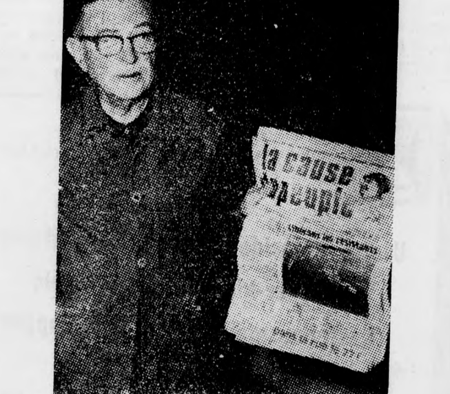
SARTRE — A SAJTÓSZABADSÁG VÉDELMEBEN

Sartre — úgy mond — nem annyira azért vállalta a lap fő-szerkesztői tisztjét, hogy „megvédje A Nép Ügyét”, hanem azért, hogy megvédje a sajtószabadságát”. Nem azonosítja magát La Cause fanatikusan szélbaloldali felhívásaival, amely legutóbb öles fejcímekkel