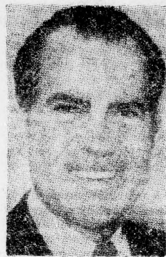
legmagasabb szinten készítse elő Izrael hadügyminiszterének Washingtoni találkozásait.

Rabin nagykövet legfontosabb teendői közé tartozik most, hogy