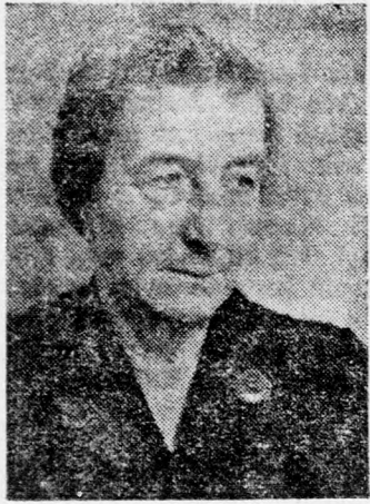
Szeretnénk visszatérni a tárgyaló asztalhoz, ám előbb bizonyos alapvető fontosságú kérdések tisztázandók.

A miniszterelnök Nixonhoz intézett üzenetében, kiszivárgott hírek szerint ismét hangsúlyozásra került, hogy