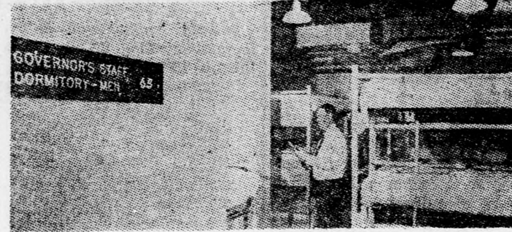
A kormányzó és munkatársainak hálóterme

szereplési Központ — Albany (New York állam fővárosa) külvárosában van és szobáit jelenleg a Légoltalmi Hivatal tisztviselői foglalják el. Asensio altábornagy igazgatói irodája például