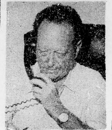
ALON Biztonsági szempontok alapján

falusi települések szervezése nem halad kellő ütemben, annak ellenére, hogy ez a kormányzati alapelvek egyik szakasza. Amikor