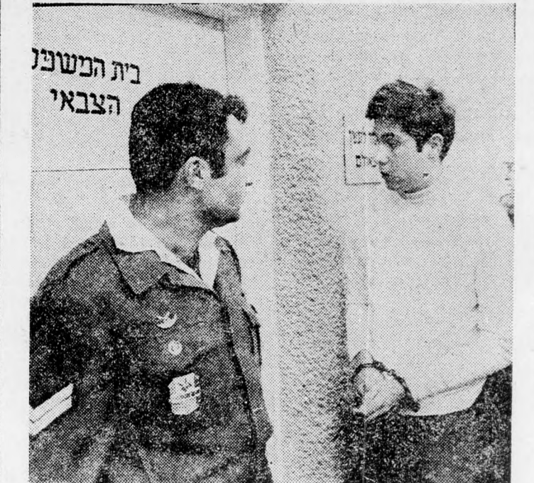
A 15 évi fegyházbüntetésre ítélt svájci fiatalember az ítélethirdetés előtt a hadbírószágon.

ni, hogy azt a Sálom áruházban helyezze el a Palesztinai Felszabadító Népfrent megbízásából.