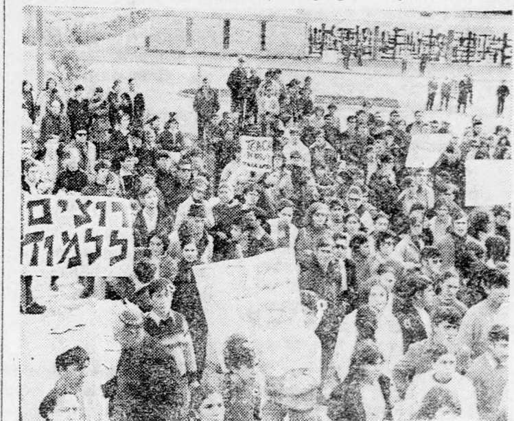
A tüntetők egy része a Kneszet előtti térségen

A Kneszet előtti térségen az ugynevezett Menora téren délután megrendezett tüntetésen néhány száz középiskolai diák és a központi szülőbizottság néhány tagja vett részt. A gyűlésen a felszólalók egységesen azt követelték, hogy a tanárok újítsák fel az oktatást, tekintettel arra, hogy a kormány legutóbbi javaslata elégséges bázist képez további bérkövetelések letárgyalására. A gyűlés résztvevői hangszólyozták, hogy ez a tüntetés, amelyet a Kneszet épületével szemben Reuven Birkát házelnök elzárta engedéllyel tartanak, nem irányul sem a kormány, sem pedig a sztrájkoló tanárok ellen, hanem elsősorban a cédit szolgálja,