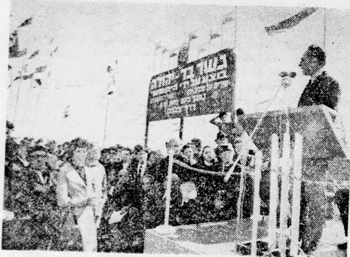
Simon Peres közlekedésügyi miniszter beszédét tartja a hídavatási ünnepségen

„Ez a híd szimbóluma és kezdete annak az óriási méretű fejlődésnek, amely az elkövetkező évtizedekben megváltoztatja Tel-Aviv arculatát és közlekedési képét” — mondotta tegnap Simon Peres közlekedésügyi miniszter a tel-avivi Ibn Gviról utca folytatásánál felépült új híd avatási ünnepségén.