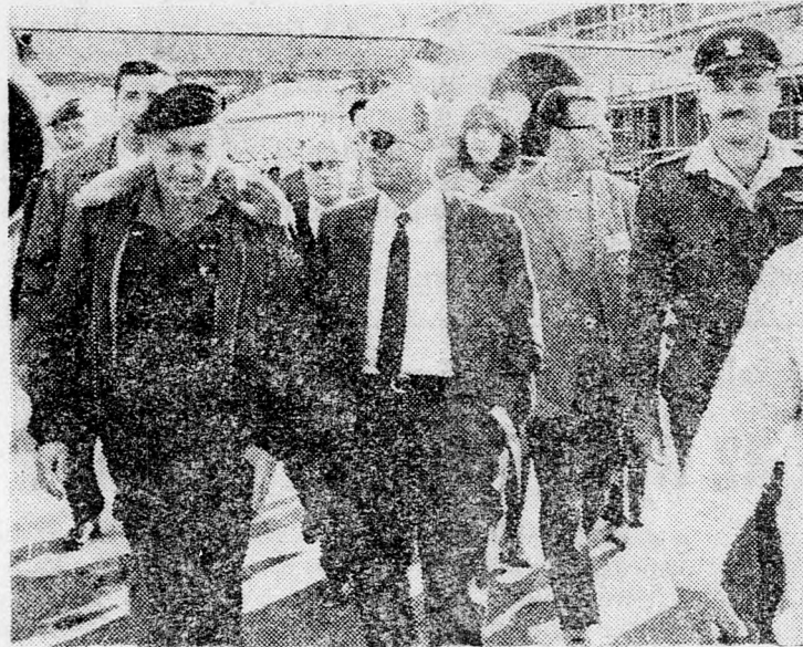
Mose Dáján hadügyminiszter a luddi repülőterén Cháim Bar-Lév tábornok vezérkari főnök és Mordecháj Hod tábornok, a légierő parancsnoka társaságával

nek tehát nincs semmilyen kapcsolata azzal, hogy februárban véget ér a tüzszünet. Különben is, nem kaptam megbízatást a kormánytól, hogy a Jarring tárgyalá-