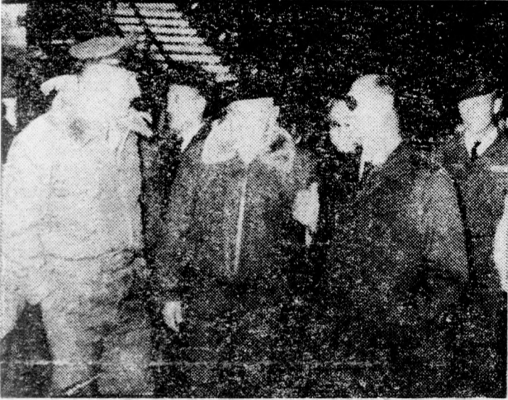
Mordecháj Hod és Chajim Bár-Lév tábornokok fogadták Mose Dajánt Luddon