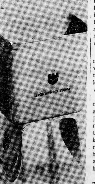
A rögzíthető plasztik szemétkosárka

szegülő mindenfajta hulladék. A kosárrak tartalmát az autó-tulajdonos természetesen — hi-szen ez a cél — csakis otthon, vagy az utcai személtádkba írtat ki.