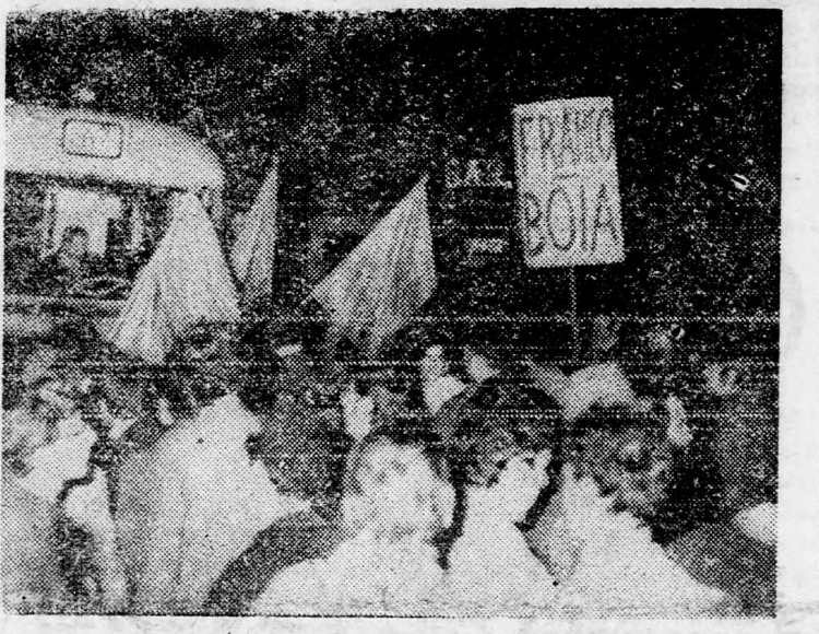
Rómában a Spanyol téren hatalmas tüntetés folyt a spanyol nagykövetség előtt a burzoi ítéletek ellen. A tüntetők nagy táblát vittek „Franco hóhér” felirással. (Lásd beszámolókat a 6. oldalon)

A Bné Brit Rend jeruzsálemi páholyának tagjai tegnap ünnepeket keretében között gyújtották meg a 8-ik chanukagyertyát Zálmán Sázár államelnök rezidenciáján. A jeruzsálemi fiókszervezet elnöke, Mose Sámír üdvözlő beszédet mondott. Ben Cion Kauders, a Bné Brit rend országos felügyelője elmondotta ez alkalommal, hogy a Bné Brit különböző határmenti településeket, valamint 25, -felszabadi tótt területeken létesített települést tett gondozásba. Zálmán Sázár elnök megköszönte a Bné Brit rend üdvözlését és beszédében megemlékezett a leningrádi perről, illetve a szovjet zsidóság sorsáról.